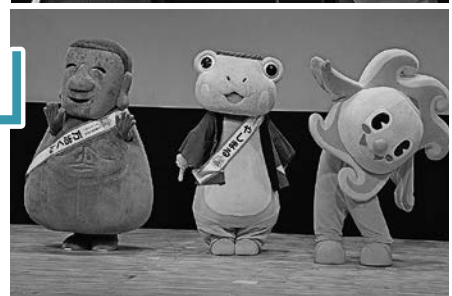
町のキャラクターたちもお祝いに