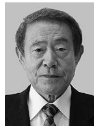
さがらかい 相楽会 様

消防団長などを歴任し、長きにわたる消防団経験から、消防団員の良き指導者として地域防災力の強化に尽力されました。