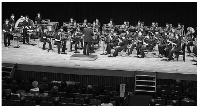
下諏訪向陽高校吹奏楽部による記念演奏