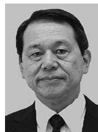
武藤工業 株式会社 様