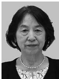
みたまち おかみさん会 様

多年にわたり保護司として相談や指導を行い、非行などからの立ち直りの支援など、地域の犯罪防止や更生保護活動に尽力されました。