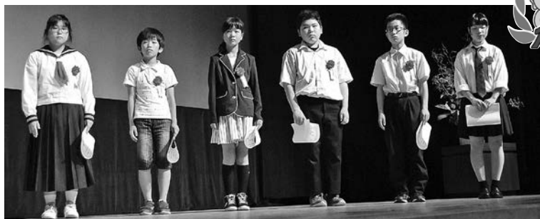
表彰された皆さん