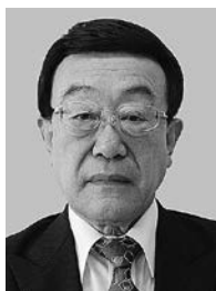
株式会社 荻原製作所 様

「氷江り」会社創業70周年の記念として、秋宮スケートリンクを描いた金山平三氏の絵画を寄附いただきました。