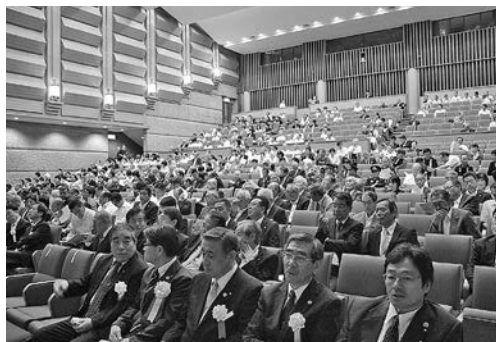
大勢の方にお越しいただきました

町制施行125周年の記念事業はこれからもまだまだ続きます。多くの町民の皆さまのご参加をお待ちしております。